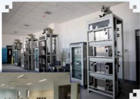
智能电梯安装调试 维护训练场所